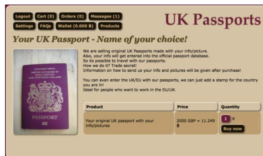
図表4 ダークウェブで売買されるパスポート

合法の電子商取引市場が拡大するのと同時に、ダークウェブにおける違法な電子商取引市場も拡大しているのである。