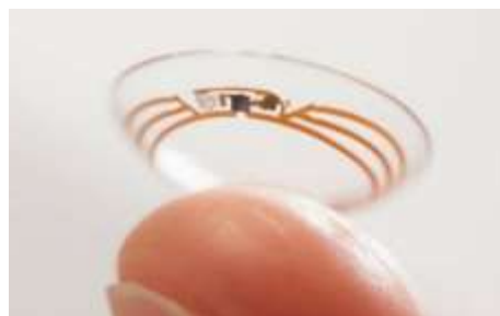
図表3 スマートコンタクトレンズ

一方、平成30年10月には名古屋大学、科学技術振興機構（JST）が発電とセンシングを同時に行うセンサーを開発したと発表している* 2 。このセンサーが開発されたことにより外部からの給電を必要としないコンタクトレンズ方式による持続型の血糖値モニタリングが可能となった。涙に含まれる糖をモニタリングしながら、必要電力を生成することが可能な画期的な技術となっている。今後、持続型血糖値モニタリングのコンタクトレンズが低価格化すれば、皮下部分に埋め込むインプラントブルデバイスよりも幅広く展開されることが期待される。