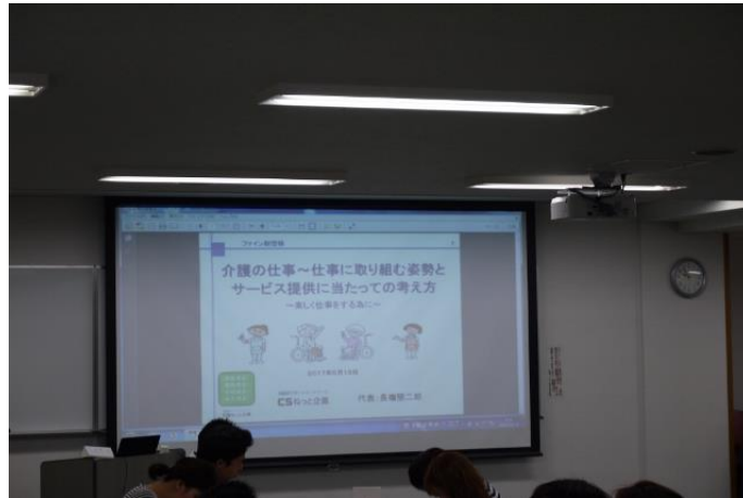
介護の仕事:仕事に取り組む姿勢とサービス提供にあたっての考え方 講師 CSねっと企画(同) 代表 長嶺堅二郎