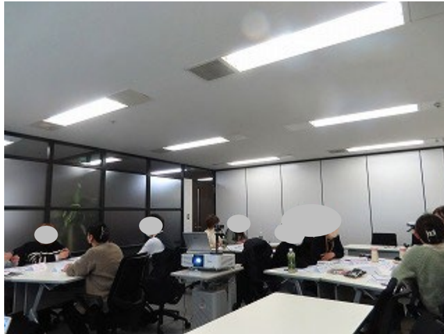
オンライン参加の方とディスカッション中